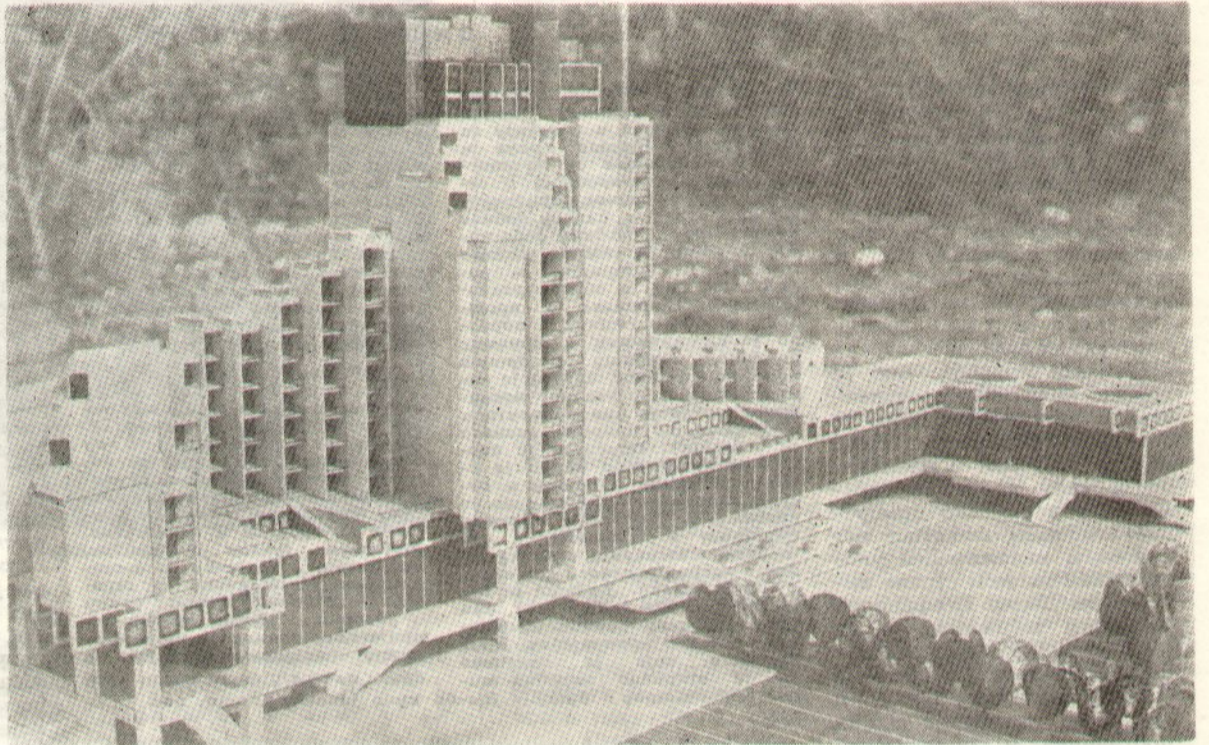
Још увијек само макета

Т ОПЛА ЛЕТА И ВЕОМА БЛАГЕ ЗИМЕ представљају идеалну основу за развој туризма у овом крају. А и како неће, када су у њему јесени топлије од пролећа и где преко 300 дана у години жива у термометру не силази испод 10°C? Додајмо још и то да се она свега пет дана годишње креће око тачке мржења и да је средња годишња температура Будве нешто виша него на Азурној обали. Дуготрајна осунчаност, која у купалишној сезони траје око девет и по часова дневно, веома је погодна за развој климатско-љечилишног туризма, поготову што су у нијеску и шљунку пронађени многи лековити састојци. Када се, уз све то, има у виду да би се организацијом боравка море-платина, и то љети и зими, могао, као ријетко где, остварити висок степен комплементарности између морске обале и планинског подручја, онда постаје јасно колико бројни и значајни задаци још нијесу остварени. Изградњом модерне саобраћајнице Будва — Цетинје, на којој су ових дана почели радови, и базена у Будви и Пржњу тек су учињени први кораци у правцу развијања туристичке покуде.