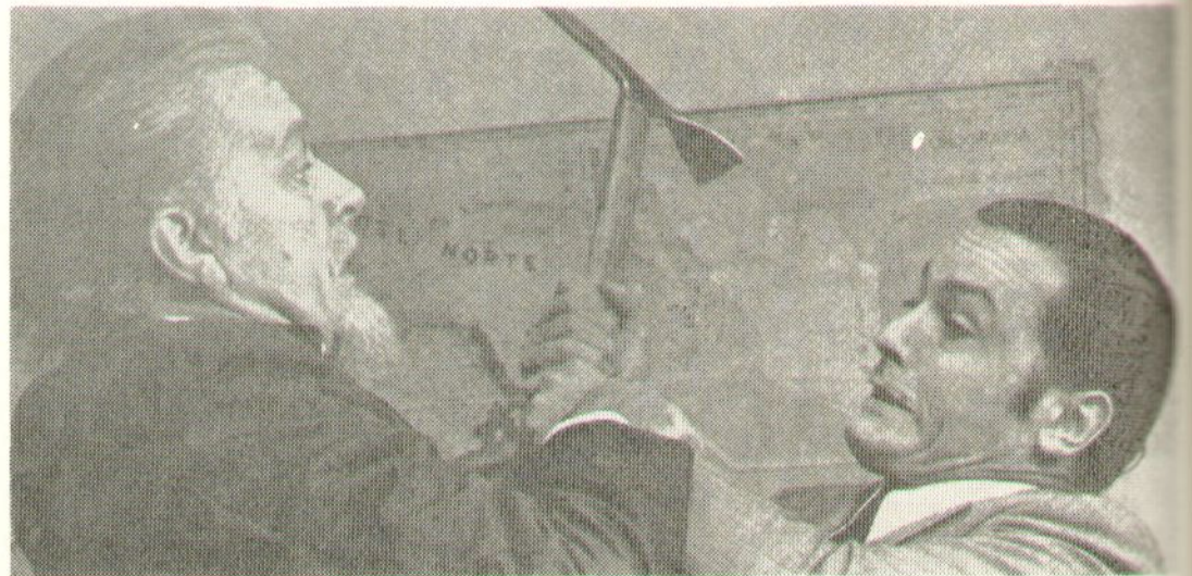
Сцена из филма „Убиство Лава Троцког“

Списак ћемо завршити југословенско-совјетским филмом „Живјети за инат“ који расправља савремену историју вријеме, вјечну трагедију шта се све у животу не чини упркос објективног стања и — логике! Главни јунак, Владика Петар I, враћа се у ратом опустошену земљу у којој харају глад и болести. Вишеструко активан он све вријеме надвладала и слове и побјеђује реалност сагледава далеки циљ и ериктирно спроводи у живот идеју која је у почетку савијетској јасна. Једном ријечју овај Иљенков филм је драма која траје: завађена племена, куга, погибије, пожари. Махмут-паша Бушатлија. Епизод је побједа на Крусевама, али и крвна освета која се наставља.