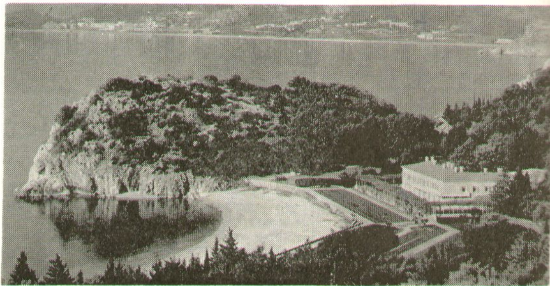
Милочер — резиденција најдражег госта за вријеме боравка у Црној Гори

Разматрајући стање информисаности у предузећу „Свети Стефан“ одлучено је да радна организација покрене лист у коме ће се радници обавјештавати о свим важнијим одлукама донесеним од стране органа управљања, на зборовима радних људи итд. Лист ће излазити једанпут мјесечно.