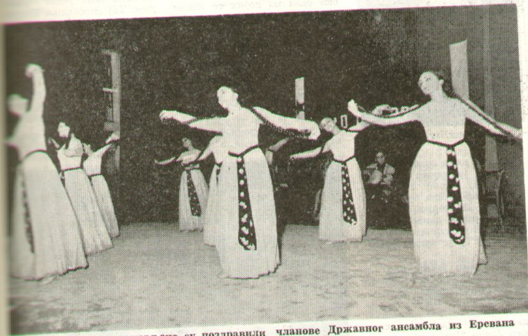
Грађани Будве одушевлено су поздравили чланове Државног ансамбла из Еревана

Ових дана Совјетски народ слави велики Јубилеј — 30 година од оснивања Социјалистичког савеза. Овај празник ми славио у гостопријемној земљи Југославији међу Црногорским друговима у гостопријемној Будви.