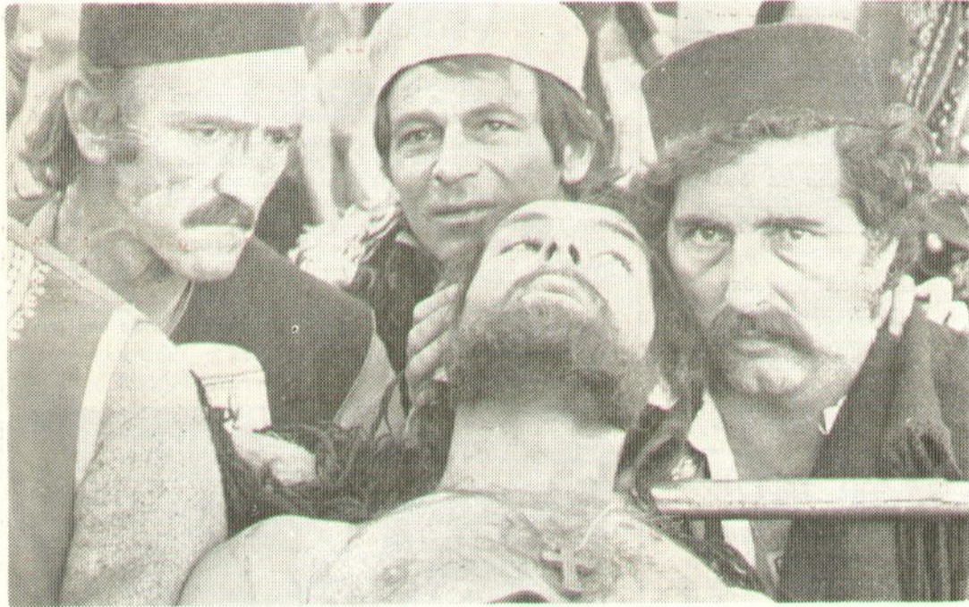
Кадар из филма „Живјети за инат“