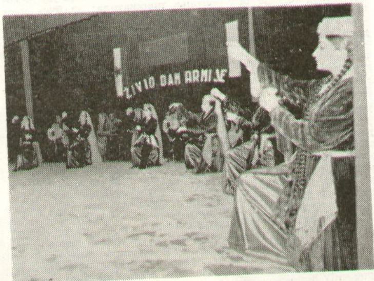
Свирачи јерменског ансамбла побрали су бурне аплаузе многобројних гледалаца