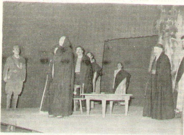
Сцена из драме „Свечаност се одлаже“

човјеку. Сви велики, преломни, епохални догађаји имају своје људе, своје носоце, своје аутентичне свједоке и мученике. Људи из пећине, сви до једног, били су велики људи у пећини. Јелена је од свих већа јер је мајка. Она је та која Револуцији даје и оно што је најсветије — дијете. Људи то памте, носе, заборављају, или хоће да се очисте од тога. Јелена им не да да своје мирнодопске савјести потпуно успавају. Она их буди, она их и данас спасава као и онда у пећини. Можда по-